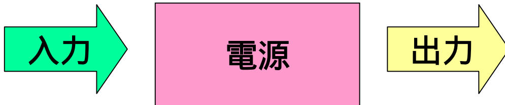
図 1.1 電源装置

たとえば、交流を直流に、直流を交流に、100V の電圧を 50V に、 回転エネルギーを電気エネルギーに、一つの電圧を複数の電圧に、 などなど